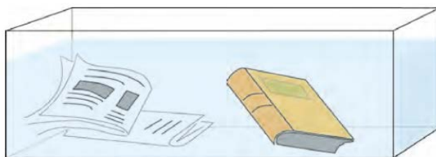
▲ Dans l'aquarium (1) : papiers (journaux, livres, magazines avec couvertures pelliculées, glacées...)