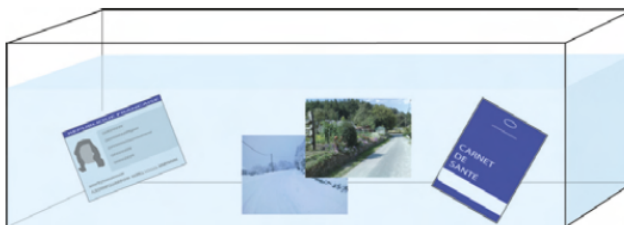
▲ Dans l'aquarium (3) : objets personnels importants (photos, faux papiers d'identité...)