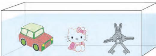
▲ Dans l'aquarium (2) : objets divers (jouets, téléphone...)