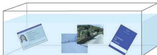
▲ Dans l'aquarium (3) : objets personnels importants (photos, faux papiers d'identité...)