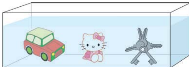
▲ Dans l'aquarium (2) : objets divers (jouets, téléphone...)