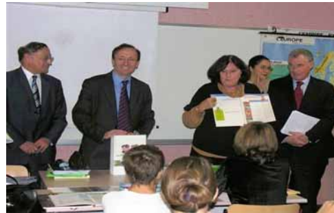
Remise des livrets aux élèves du collège Pierre de Coubertin de l'académie de Versailles.

Un ou plusieurs collèges pilote par département ont été identifiés en septembre et octobre 2007 pour tester le livret de l'élève pendant l'année scolaire 2007-2008.