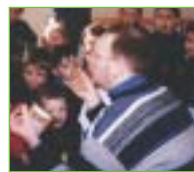
Présentation des comprimés d'iode aux élèves

article complet sur la simulation et possibilité de télécharger « l'agenda des événements à l'école de Penly » et « la synthèse des fiches d'observation » des enseignants des 5 écoles. www.acrouen.fr/rectorat/profession_rme/r_m_e_2002.htm#penly