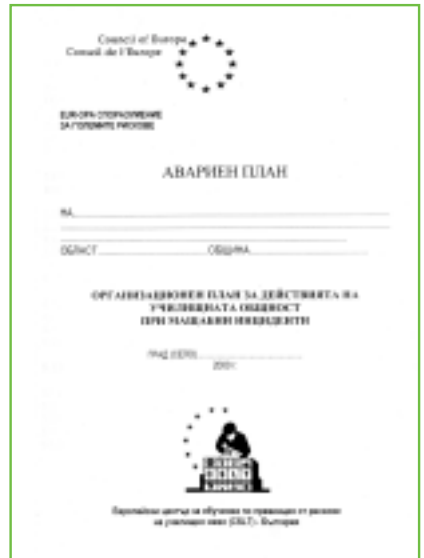
Le Plan SESAM traduit en bulgare