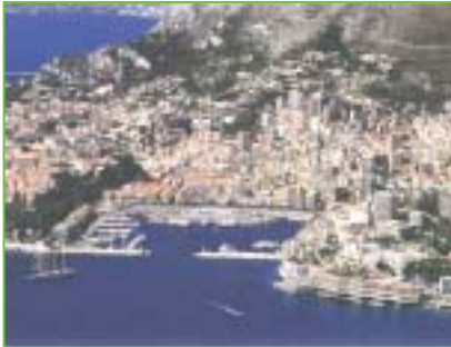
La principauté de Monaco