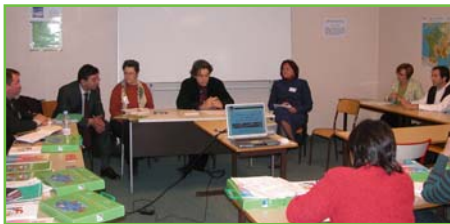
Formation nationale de formateurs RMé, Toulouse, avril 2005

Les Conseils généraux sont eux-aussi progressivement sensibilisés soit par l'intermédiaire des chefs d'établissements, soit lors d'une participation à un exercice de simulation ou à une commission départementale d'hygiène et sécurité d'une Inspection Académique. Le Conseil régional Midi-Pyrénées a, quant à lui, élaboré en 2003 un « Guide de maintenance des lycées ». Ce guide, composé de classeurs, a été remis fin 2003 aux proviseurs et gestionnaires avec une présentation en particulier du PPMS, premier chapitre du classeur n°6. Cette partie a été écrite par le service technique du Conseil régional et le coordonnateur RMé. Le Conseil régional reste attentif aux demandes de simulations et aux questions relevant de la sécurité.