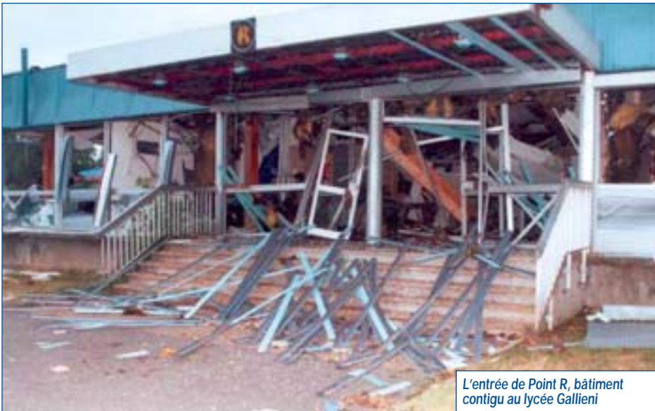
L'entrée de Point R, bâtiment contigu au lycée Gallieni

À partir de novembre, d'autres objectifs ont été définis : évaluation des