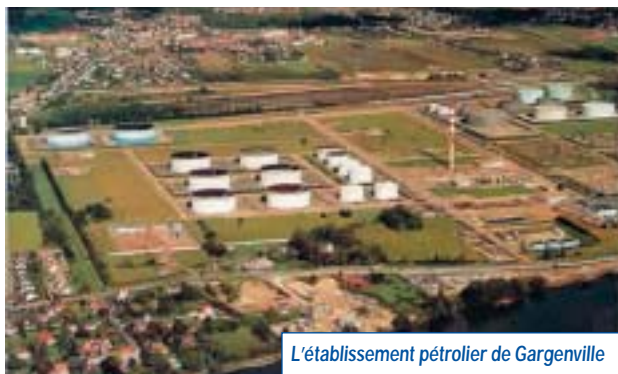
L'établissement pétrolier de Gargenville